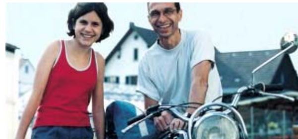
Sach- / Vermögens- versicherungen